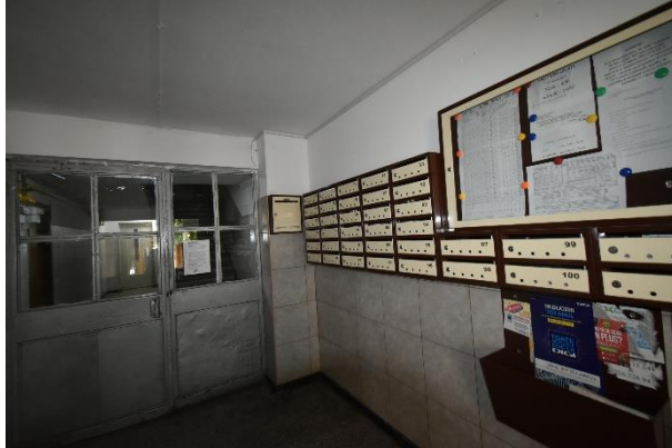
Vedere casa scarii, palier și ap. subiect: